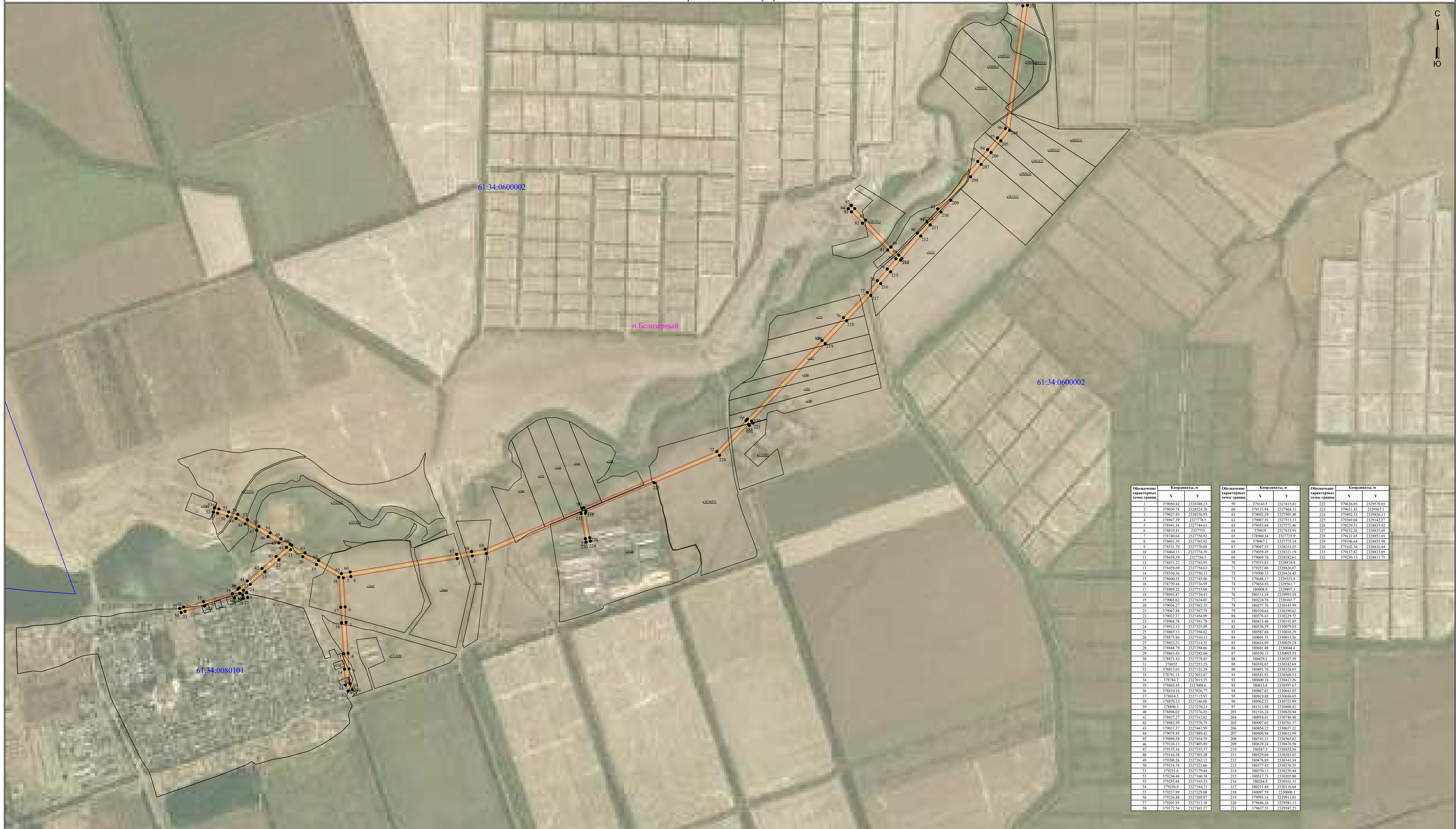
Схема расположения границ публичного сервитута для размещения объекта ВЛ-10 кВ №4 ПС Красный Партизан (наименование объекта землеустройства) План границ объекта землеустройства