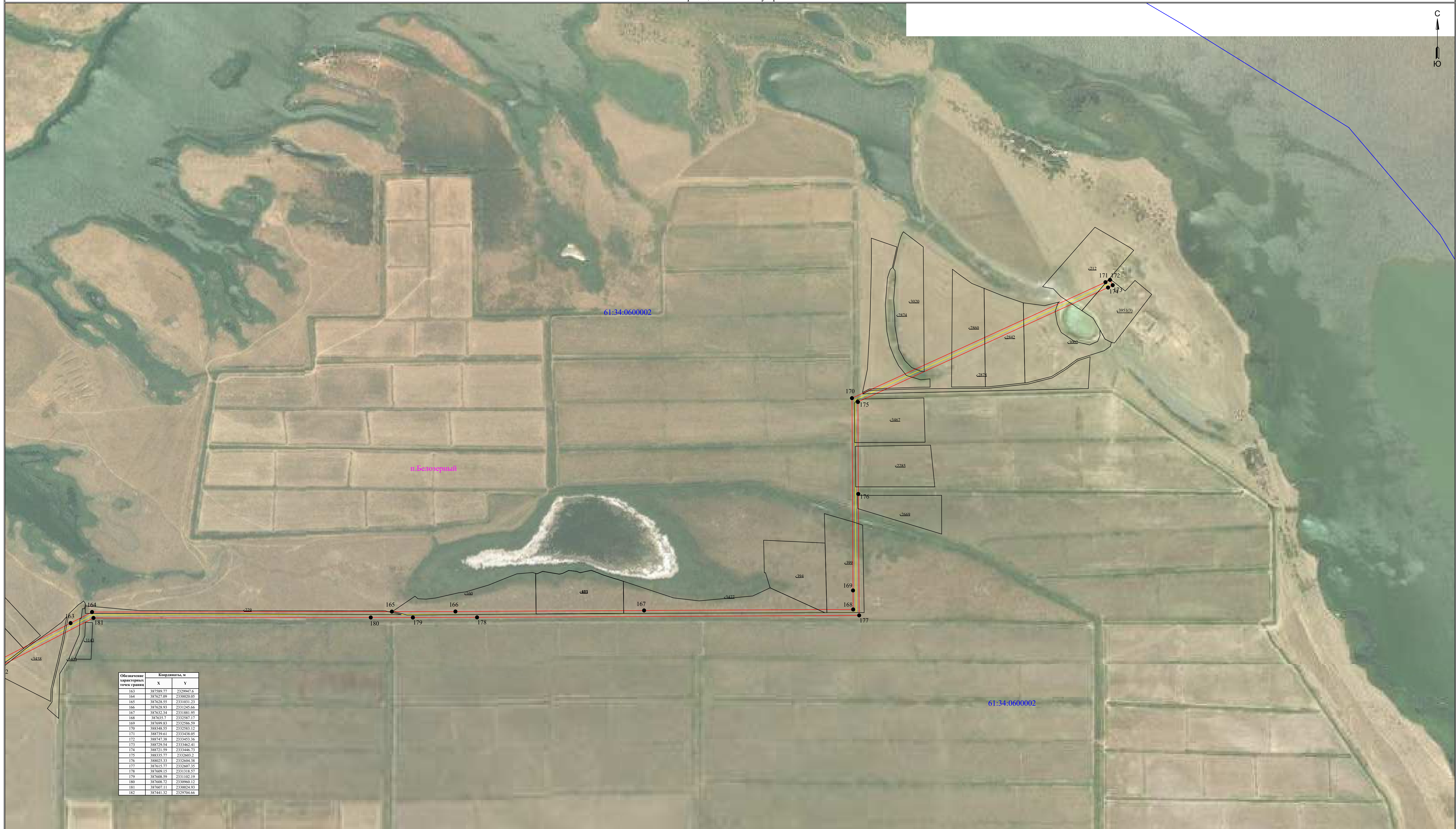
Схема расположения границ публичного сервитута для размещения объекта ВЛ-10 кВ №4 ПС Красный Партизан (наименование объекта землеустройства) План границ объекта землеустройства