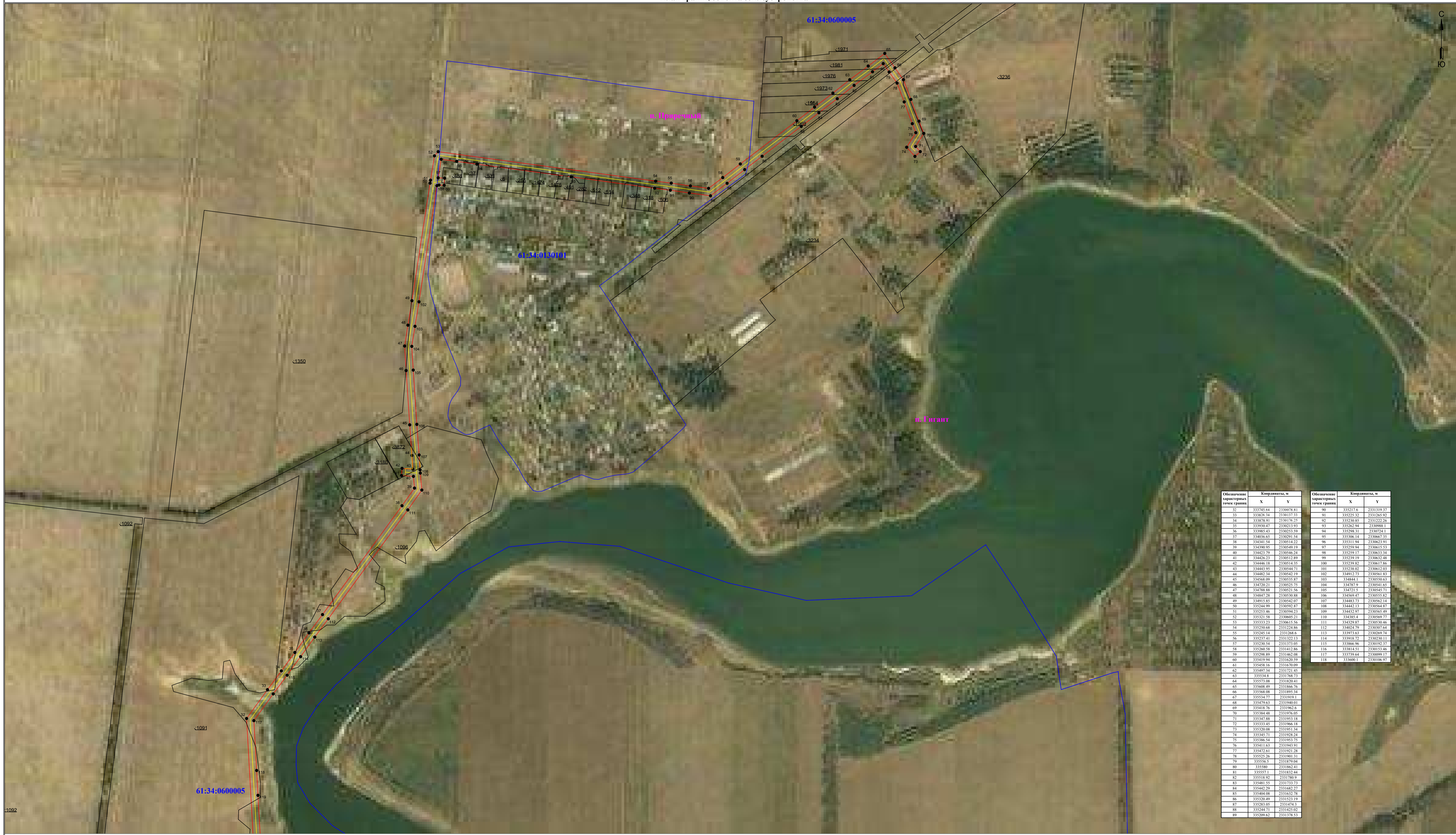
Схема расположения границ публичного сервитута для размещения объекта ВЛ-10 кВ №3 ПС Ленин (наименование объекта землеустройства) План границ объекта землеустройства