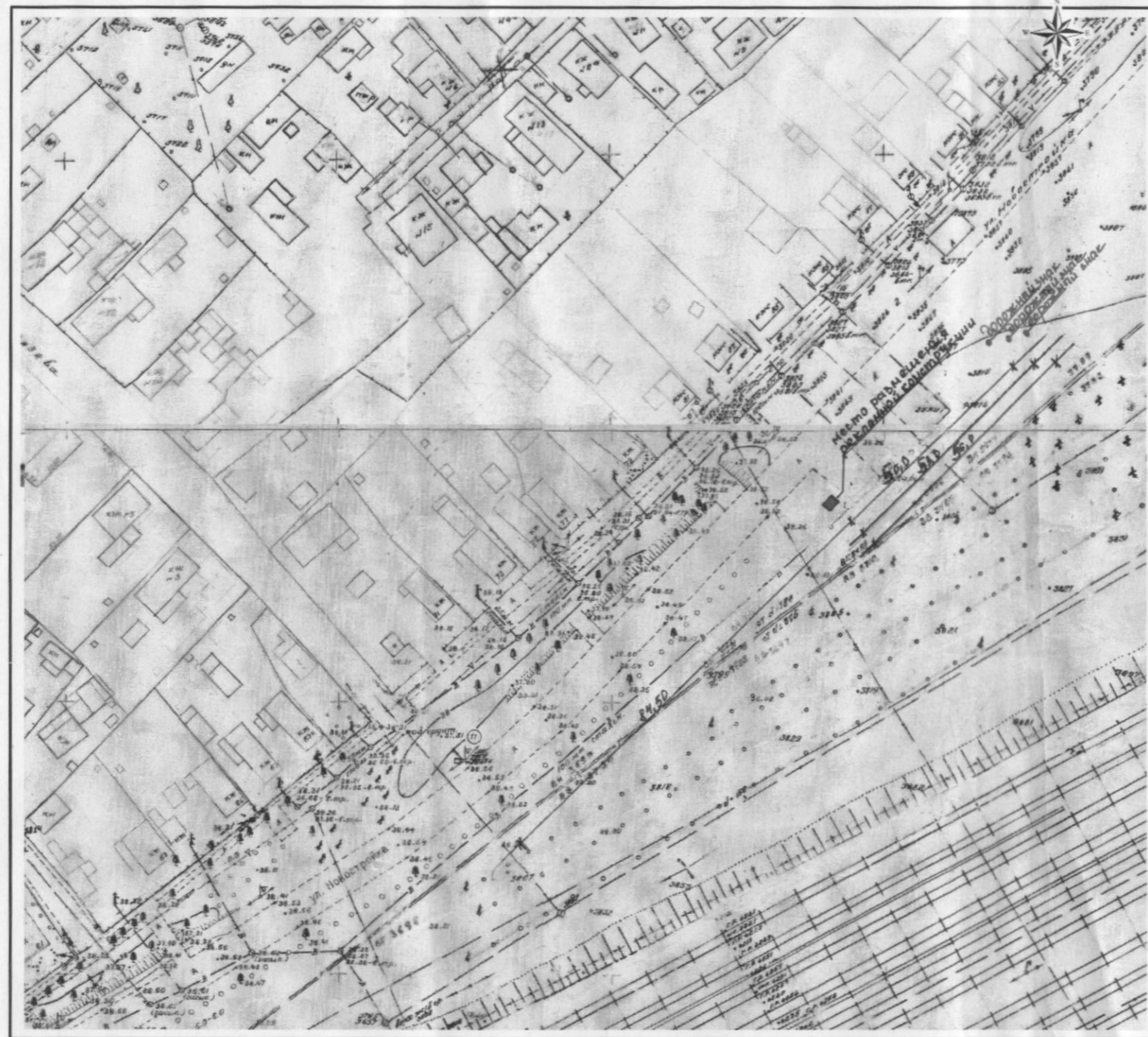
СХЕМА согласования места размещения рекламной конструкции (билборд), размером 3,0м. * 6,0м. г.Сальск, ул.Новостройка,(район меховой фабрики) масштаб 1:1000